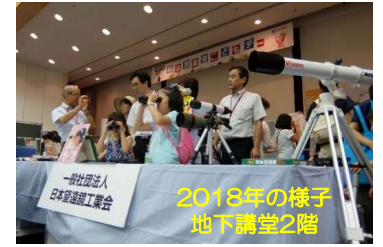
2018年の様子 地下講堂2階