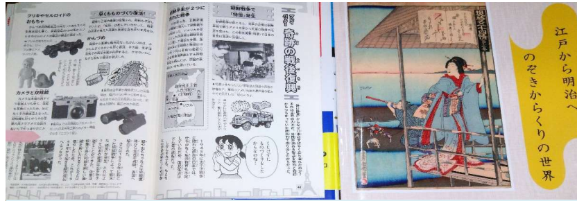
双眼鏡・望遠鏡に関する・書籍・雑誌・カタログ・ちらし・光学産業新聞など

光学ガラス材料(ブロック材) 【主なガラス部品の加工工程】 ①ろつぼ溶解(現在は連続溶解が主) ②火割り ③切断、或いはプレス型にて成型 ④研削加工 ⑤研磨加工 ⑥真空蒸着 ⑦接合