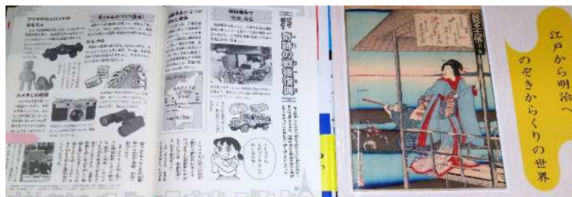
双眼鏡・望遠鏡に関する・書籍・雑誌・カタログ・ちらし・光学産業新聞など